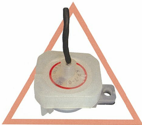
KPシリーズ 水検知用センサー インターロック機能 (ホルダー外れ検出機能) 選択可能 ケース材質ポリプロピレン (PP)