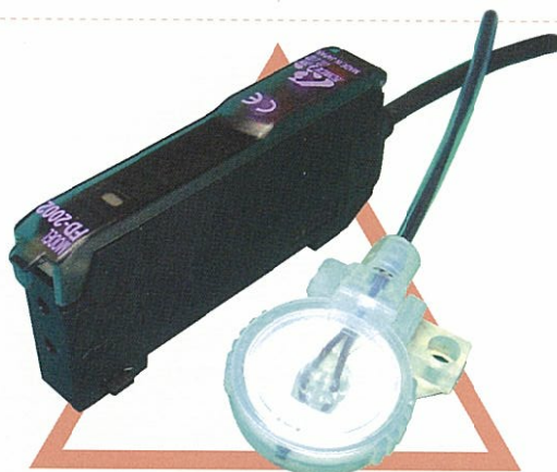
TFP-F&FD-2002-SR123 可燃性液体、防爆エリアでも使用可能 センサー本体部は電気を 使用しておりません ファイバーケーブル延長可能です