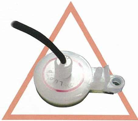
LUPシリーズ PNP出力タイプもラインナップ 水検知用センサー ケース材質ポリプロピレン (PP)