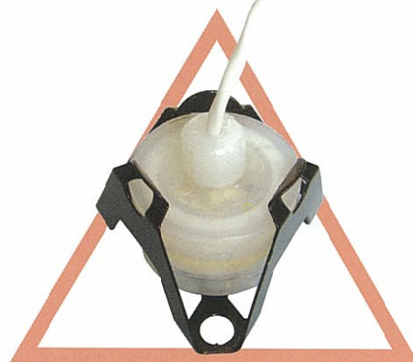
LSPシリーズ 高耐薬品性、薬液でも安心 インターロック機能 (ホルダー外れ検出機能) 選択可能 ケース材質テフロン® (PFA)