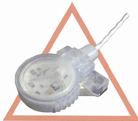
TFP-Tシリーズ PNP出力タイプもラインナップ 高耐薬品性、薬液でも安心 インターロック機能 (ホルダー外れ検出機能) 搭載 ケース材質テフロン® (PFA)